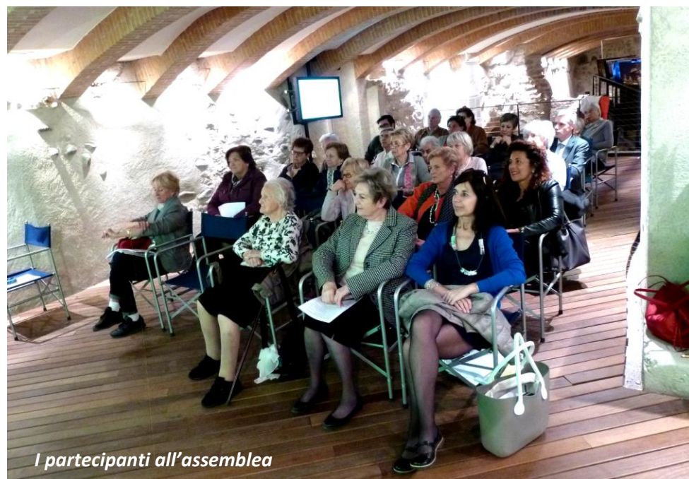
I partecipanti all'assemblea